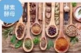
植物由来の酵素と酵母

「Organic Beauty」は、日本生まれの乳酸菌をはじめとする4種類の乳酸菌と、自社農園で育てた「3年完熟キダチアロエ」、さらに85種類の酵素と酵母の働きが、皆様の健康維持と美容をサポートします。