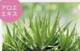
無農薬で育てたアロエ