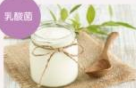
整腸を促す乳酸菌